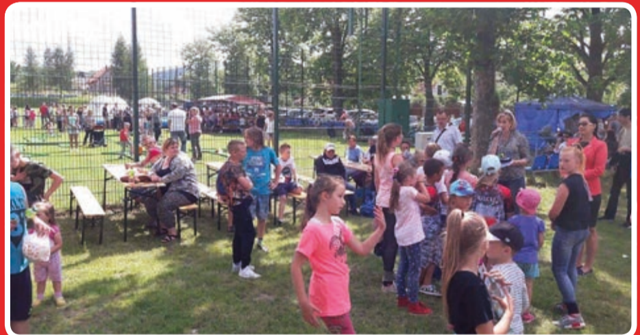
Powitanie lata w Radzie Osiedlowej nr 5