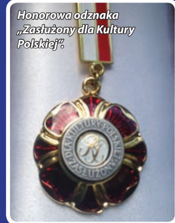
Honorowa odznaka „Zasłużony dla Kultury Polskiej”

ry brazylijskiego kompozytora Antonio Carlosa Jobima czy też Take Five Dava'e Brubeck'a.