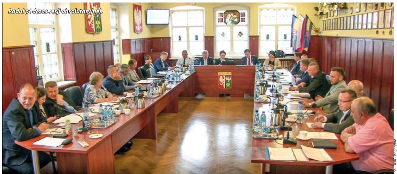
Radni podczas sesji absolutoryjnej.