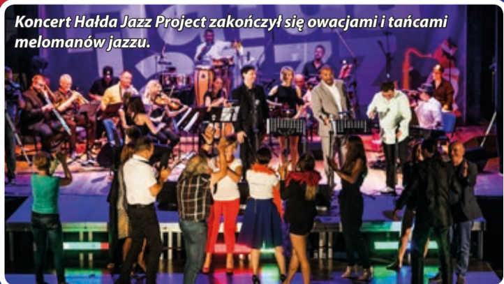
Koncert Hałda Jazz Project zakończył się owacjami i tańcami melomanów jazzu.