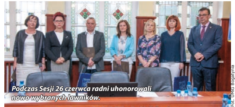
Podczas Sesji 26 czerwca radni uhonorowali nowo wybranych ławników.