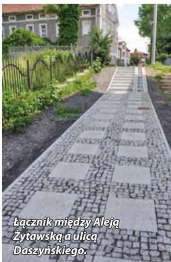
Łącznik między Aleją Żytawską a ulicą Daszyńskiego.