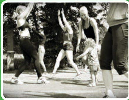
Witaj lato na sportowo w Jasne Górze