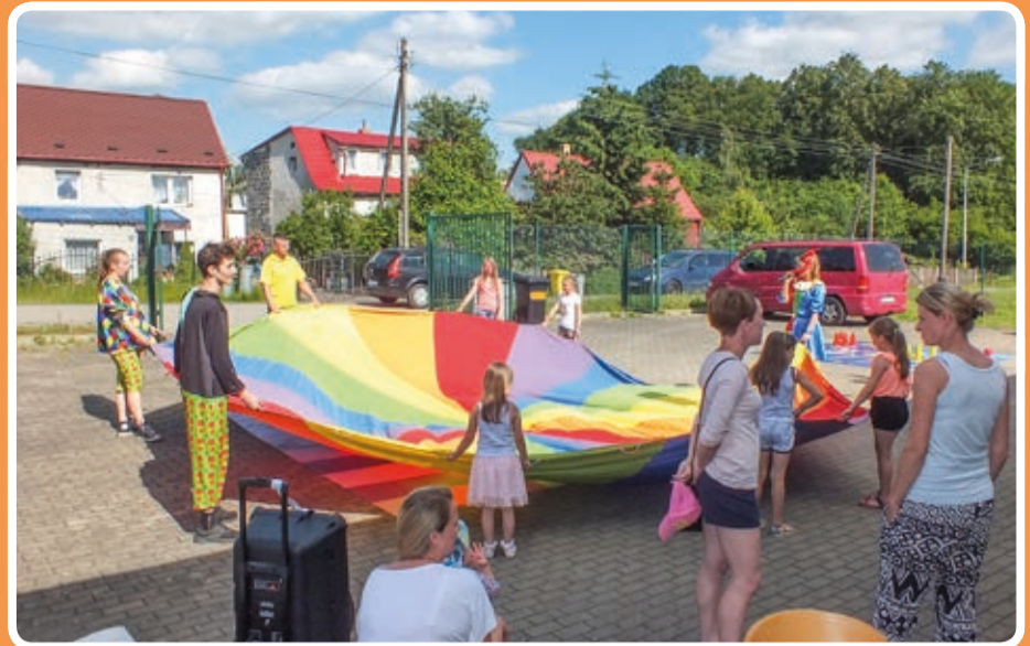
Święto uśmiechu i radości w Kopaczowie