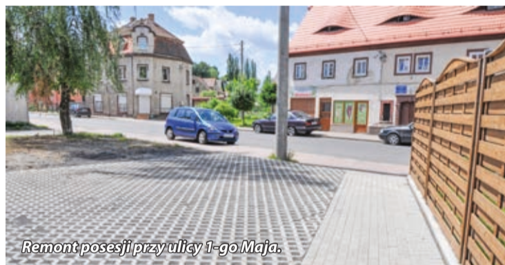
Remont posesji przy ulicy 1-go Maja.