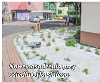
Nowe nasadzenia przy osiedlu Orła Białego.