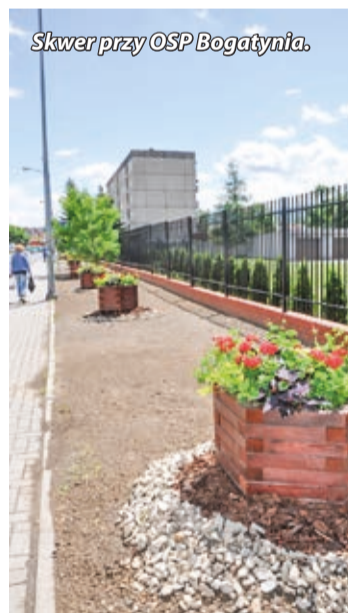
Skwer przy OSP Bogatynia.