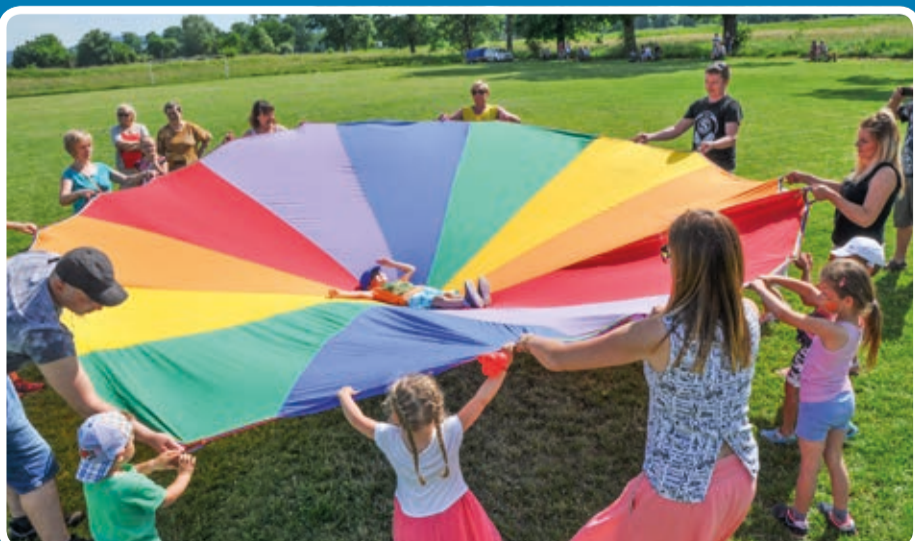
Słoneczny Dzień Dziecka w Porajowie