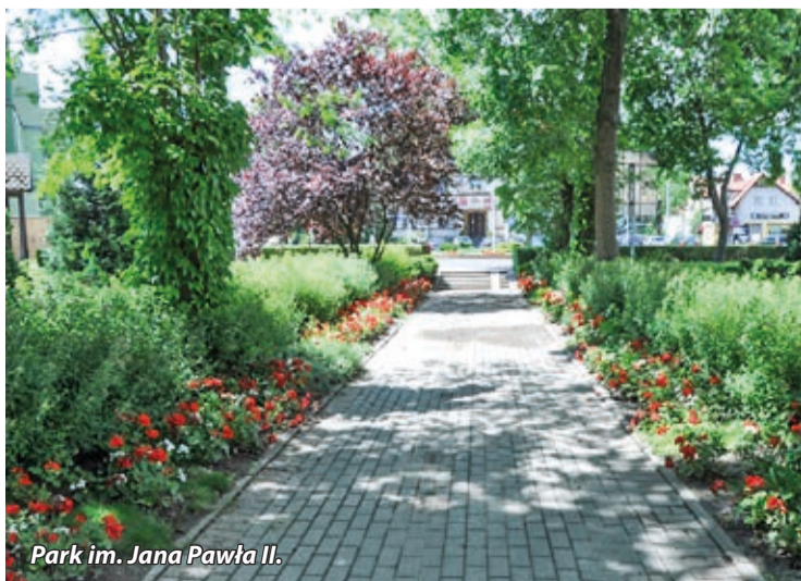
Park im. Jana Pawła II.

Estetycznym i niewątpliwie atrakcyjnym miejscem w cen-